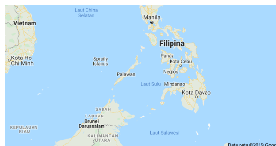
Gambar 1. Peta Laut Sulu

Laut Sulu merupakan salah satu lokasi terjadinya peperangan asimetris yang menarik perhatian bukan hanya negara – negara yang berbatasan langsung namun juga negara dalam satu regional dan pihak internasional. Negara – negara yang berbatasan tersebut adalah Indonesia, Malaysia dan Filipina. Sementara negara–negara di Kawasan Asia Tenggara yang berada dalam satu regional perlu menjaga keamanan kawasan, serta pihak internasional merasa perlu untuk menciptakan keamanan dan stabilitas global khususnya dari ancaman asimetris. Berikut ini merupakan peta Laut Sulu.