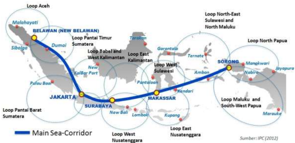
Gambar 2. Peta Rute Pelayaran Domestik