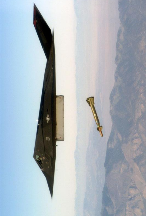
Gambar 5. Jet Tempur F-117A

Satuan Khusus Operasi Udara-16: Jet Tempur F-117A