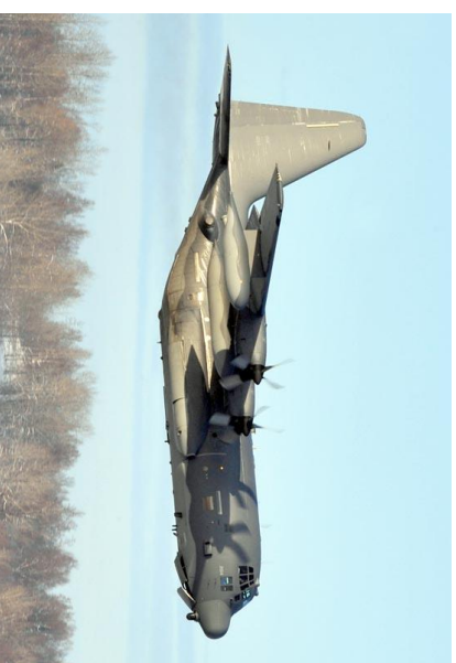
Gambar 6. AC-130