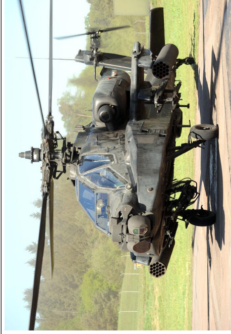
Gambar 4. Helicopter Apache