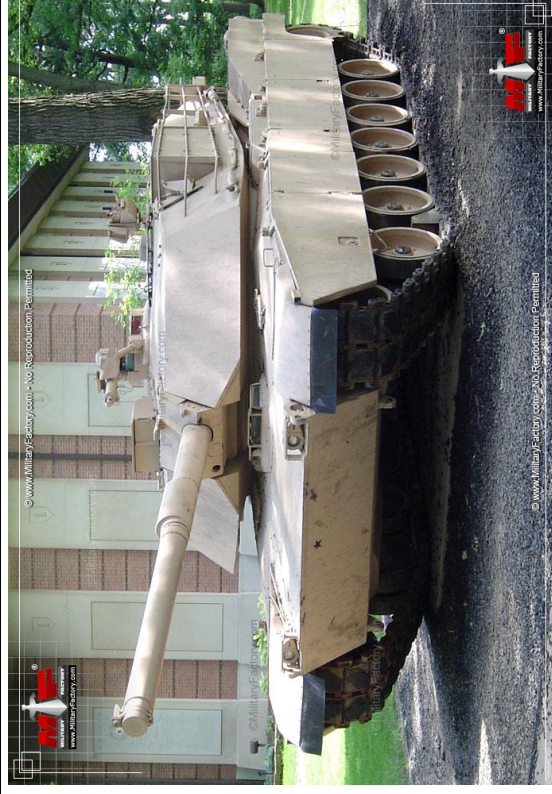
Gambar 2. Tank M1-Abram