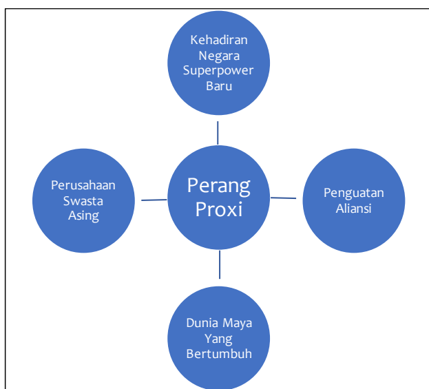
Gambar 3. Faktor-Faktor Penyebab Perang Proxy