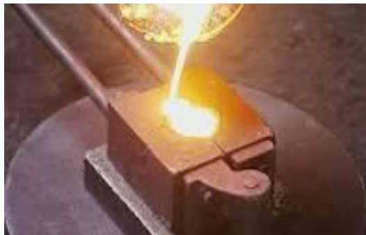
Gambar 20. Besi Tuang 14