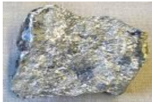
Gambar 13. Timah