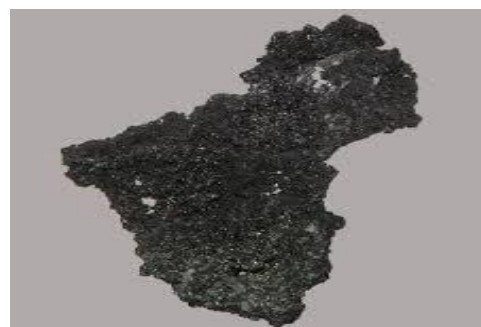
Gambar 2. Boron