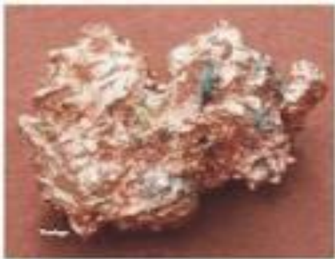
Gambar 14. Tembaga