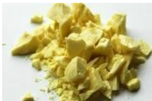
Gambar 19. Belerang

Belerang yang dalam tanda senyawa kimia telah dituliskan dalam huruf S banyak terdapat dalam campuran batubara, dimana butiran biji belerang yang melekat didalamnya itu dapat dipisahkan melalui suatu proses kalsinasi.