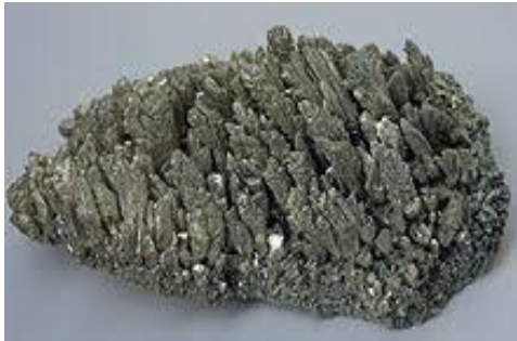
Gambar 3. Magnesium