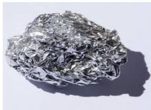
Gambar 18. Aluminium