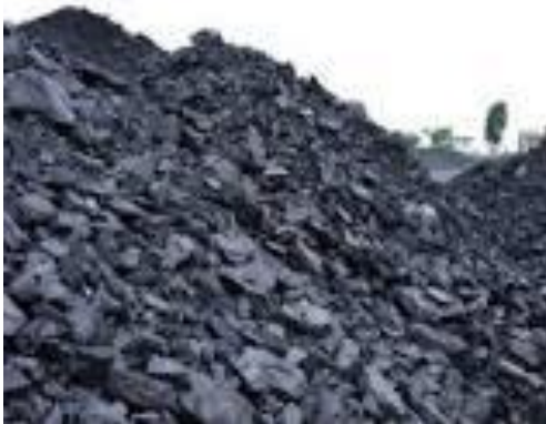
Gambar 12. Batubara

Batu Bara (Bituminus/ C_{137}H_{97}O_9NS dan Antrasit/ C_{240}H_{90}O_4NS )