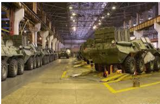
Gambar 22. Pabrik Kendaraan Lapis Baja

Besi merupakan bagian dari penampakan yang mempunyai berbagai macam warna yang ada, dimana ada assental yang mempunyai warna putih hingga abu-abu yang untuk wujudnya sendiri memiliki sifat serta format yang bulat dan biasa disebut dengan sistem round bars yang mempunyai format kotak atau segi empat dan biasa kita sebut dengan square bars .