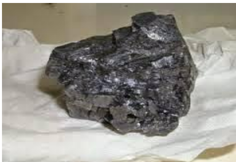
Gambar 6. Timbal