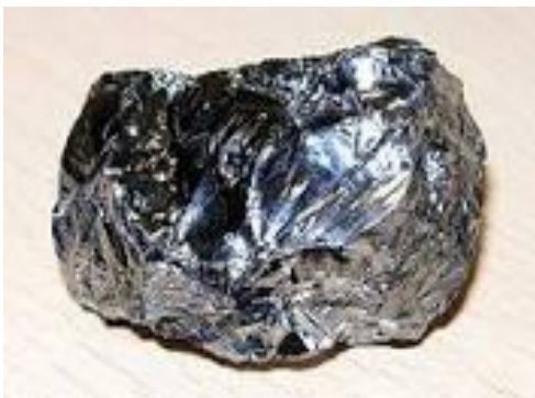
Gambar 9. Silikon