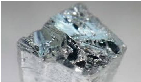
Gambar 8. Seng