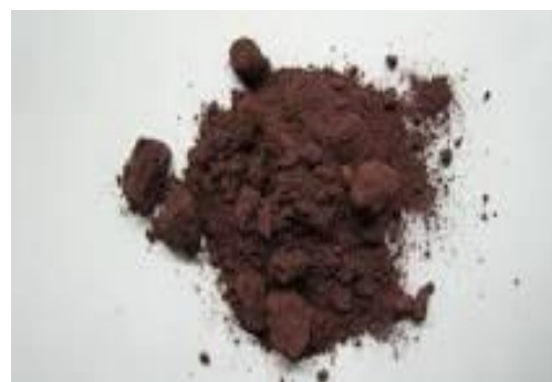
Gambar 17. Fosfor