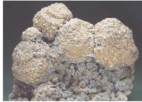
Gambar 4. Nikel