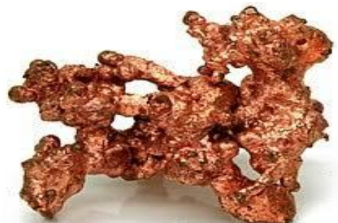
Gambar 5. Tembaga