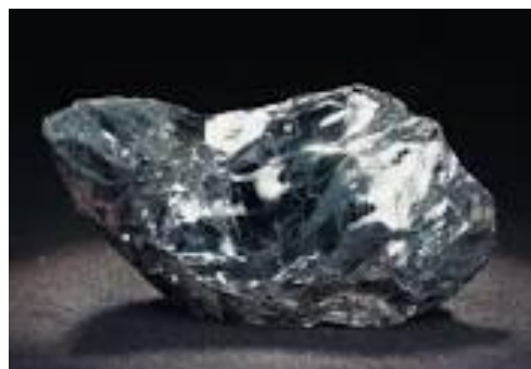
Gambar 11. Besi