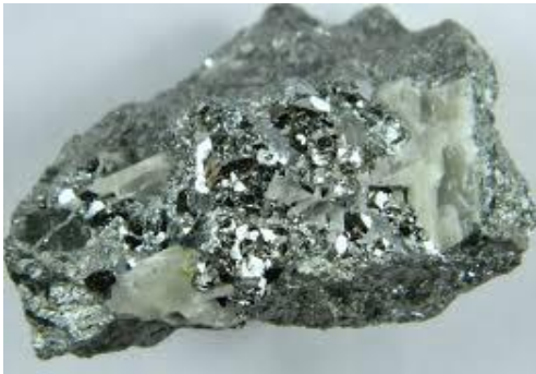
Gambar 15. Nikel

digunakan sebagai bahan dasar pembuat mata uang yang berasal dari uang logam.