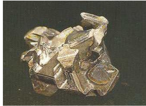
Gambar 1. Bismuth