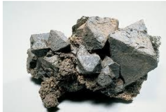
Gambar 21. Biji Besi